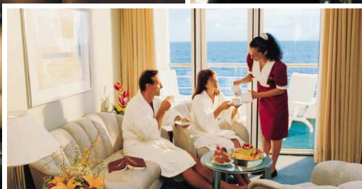
МИНИСЬЮТ С БАЛКОНОМ

Наслаждайтесь потрясающей кухней в ресторане "Горизонт" (шведский стол) на верхней палубе с круговым обзором.