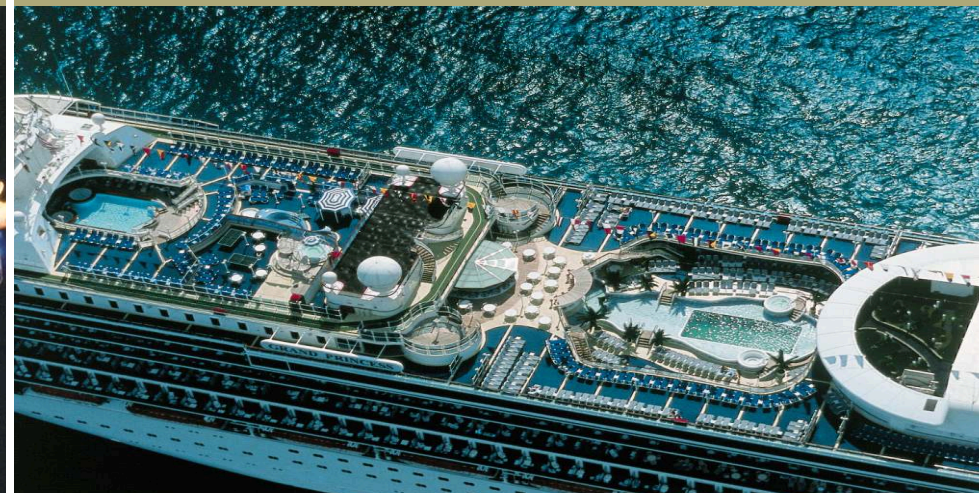
ОТКРЫТЫЙ БАССЕЙН "НЕПТУН" ▼