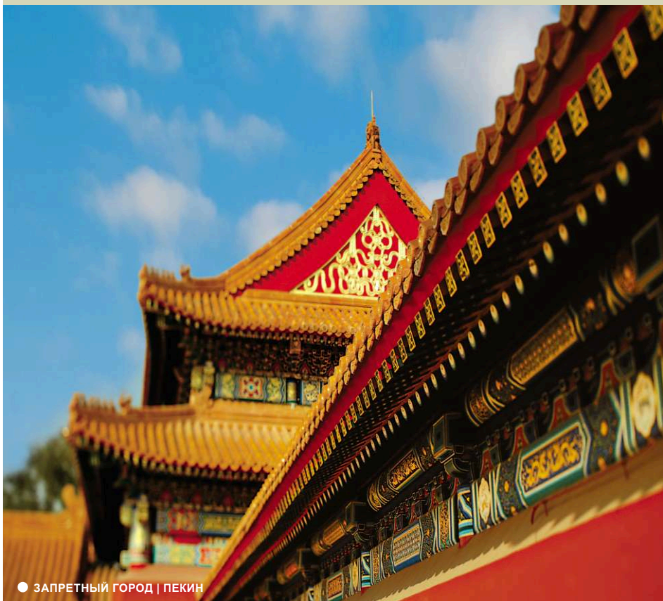
● ЗАПРЕТНЫЙ ГОРОД | ПЕКИН

Путешествие по Азии не исчерпывается одним круизом. Как правило, большинство наших туристов приезжают в Азию на 1-2 дня до начала круиза и возвращаются домой через 1-2 дня после его окончания. Чтобы сделать этот отдых максимально познавательным и удобным, клиентам предлагается пре- и посткруизная программа в виде пакета услуг на основе проживания в отелях 3*, 4* и 5* в центре Пекина и Сингапура, позволяющая познакомиться с основными достопримечательностями стран, где начинается и заканчивается круиз.