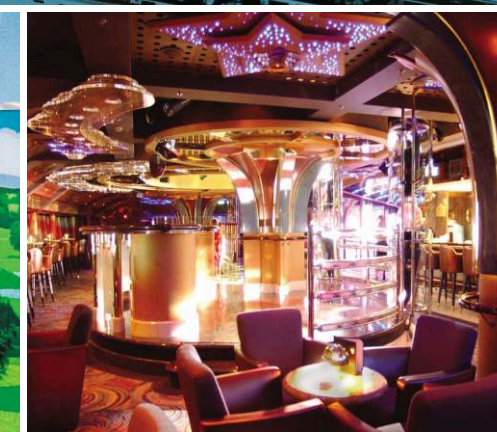
НОЧНОЙ КЛУБ "SKYWALKERS"

К Вашим услугам 5 бассейнов и 9 джакузи. Среди них: детский бассейн, бассейн со сдвижной крышей, бассейн с искусственным течением и бассейн на корме с потрясающим обзором во время движения лайнера. Для детей в бассейнах выделены специальные детские зоны. Вы можете потратить время на то, чтобы компенсировать прелести шведского стола в прекрасно оборудованном тренажерном зале. Есть возможность компанией поиграть в волейбол или сразиться в теннис. Для любителей спокойного времяпрепровождения: гольф-поле на 9 лунок или гольф-симулятор. Океанский бриз, лунная дорожка на волнах, звездное небо - на открытых палубах, а внутри: шампанское перед элегантным ужином, Ваш портрет на капитанском приеме, вечернее бродвейское шоу, дискотека до утра в ночном клубе на верхней 17-ой палубе с круговым обзором.