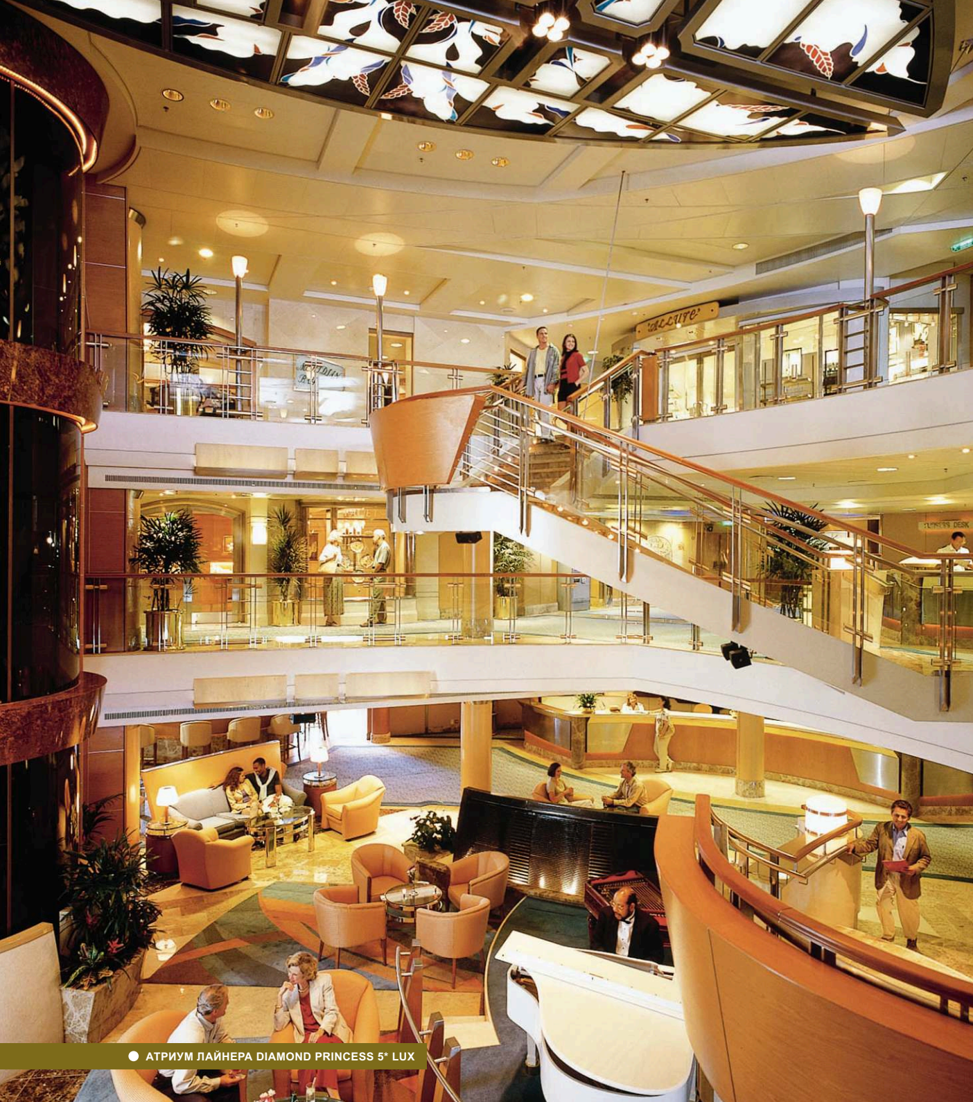
● АТРИУМ ЛАЙНЕРА DIAMOND PRINCESS 5* LUX