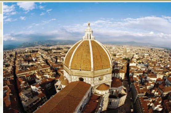
Флоренция | Италия

МЕНЮ В РЕСТОРАНАХ ЛАЙНЕРА НА РУССКОМ ЯЗЫКЕ