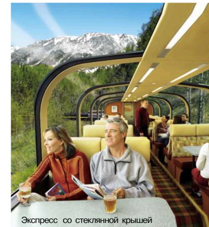
Экспресс со стеклянной крышей

12 день - переезд из Фербенкса в Анкоридж. Перелёт в Москву.