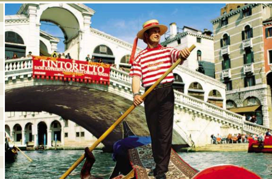
Венеция | Италия

МЕНЮ В РЕСТОРАНАХ ЛАЙНЕРА НА РУССКОМ ЯЗЫКЕ