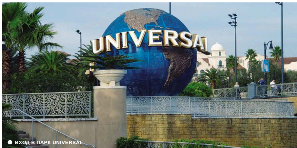
ВХОД В ПАРК UNIVERSAL

Территория комплекса Universal Orlando Resort предлагает своим гостям размещение в трех прекрасных отелях: Loews Portofino Bay Hotel 5* , Loews Royal Pacific Hotel 4* и Hard Rock Hotel 4* .