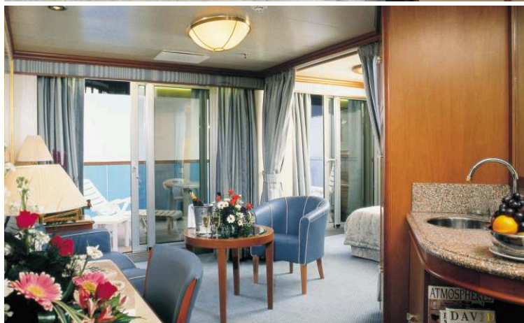
СЬЮТ И ГРАНД-СЬЮТ | в зависимости от категории 30-72 кв.м