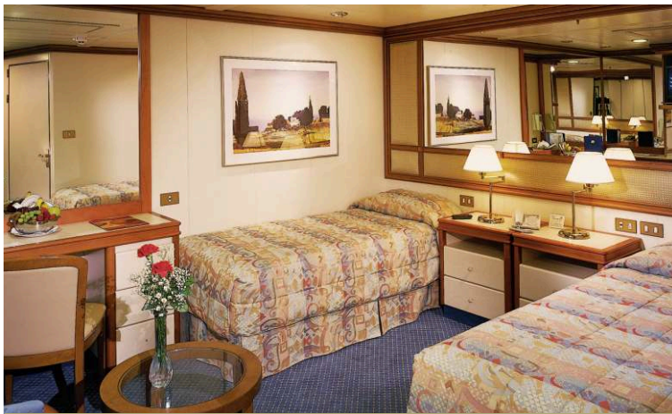
БОЛЬШАЯ КАЮТА БЕЗ ОКНА | площадь каюты 16 кв.м