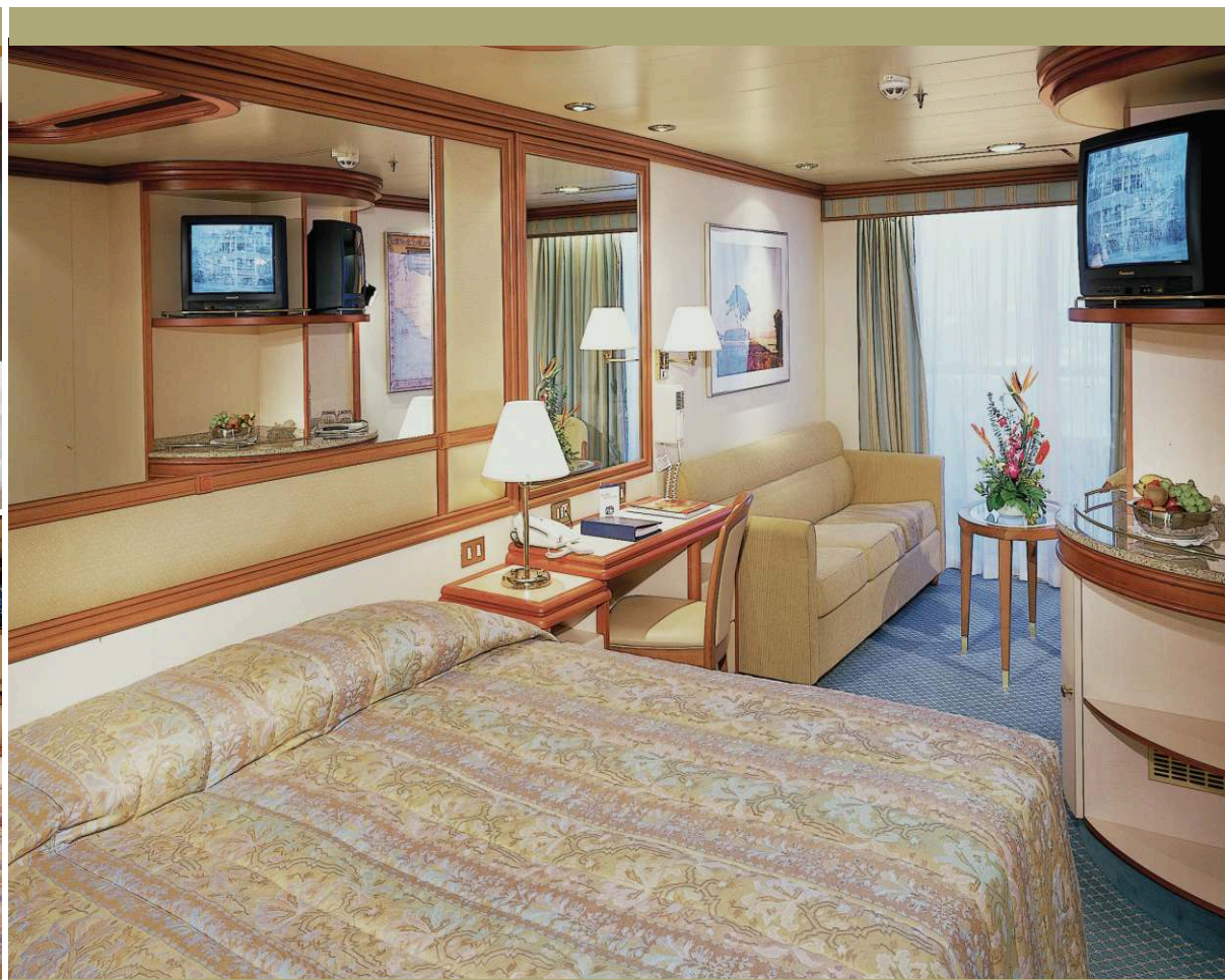
МИНИСЬЮТ НА ЛАЙНЕРАХ ГРАНД-КЛАССА | площадь каюты, включая балкон 30 кв.м