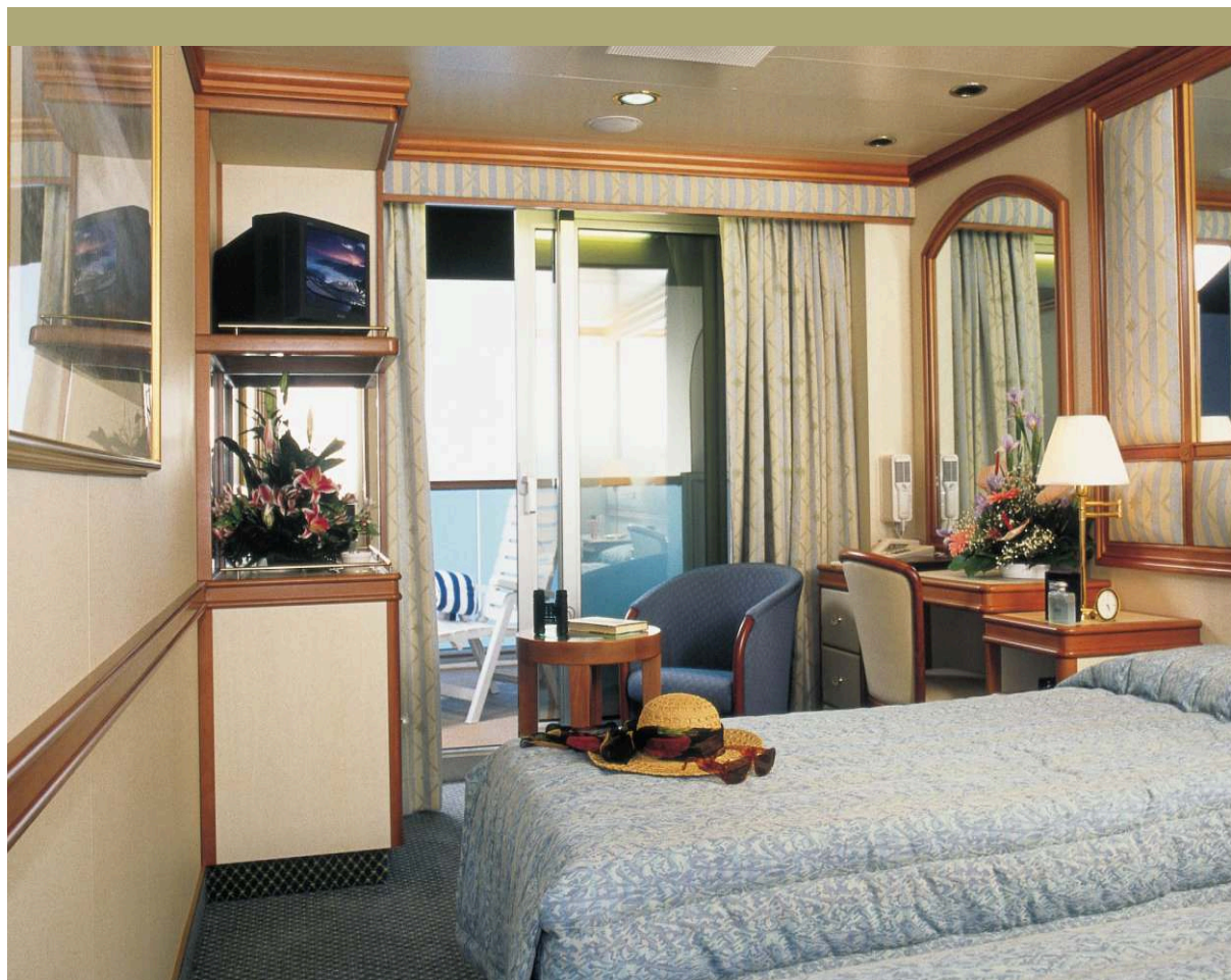
СТАНДАРТНАЯ КАЮТА С БАЛКОНОМ | площадь каюты, включая балкон 20-24 кв.м