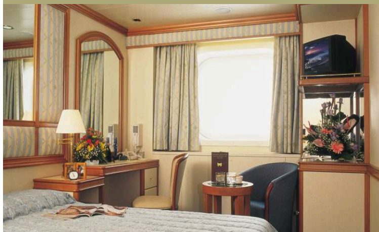
КАЮТА С ОКНОМ | площадь каюты 16 кв.м

КАЮТА С ОКНОМ: все общие стандартные характеристики + панорамное окно с видом на море. Некоторые каюты имеют загороженный вид из окна.